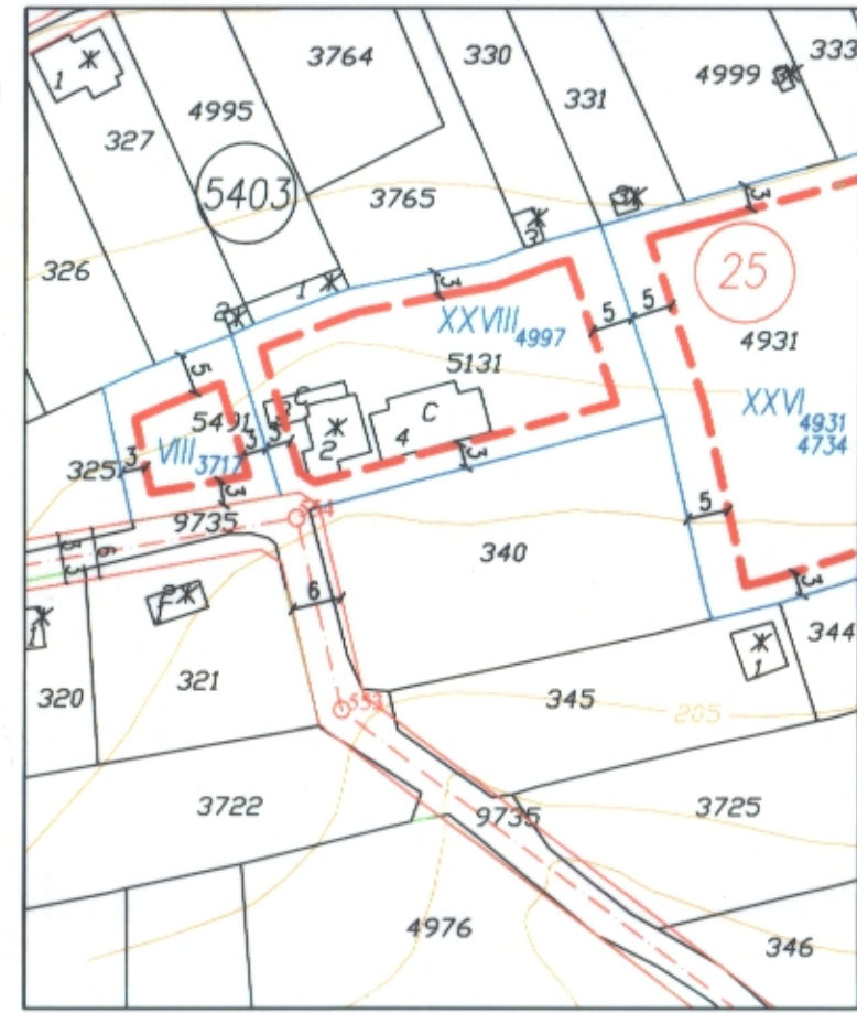
ПЛАН ЗА ЗАСТРОЯВАНЕ