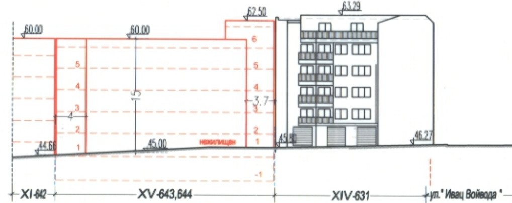
СИЛУЕТ ОТ ИЗТОК M1:500