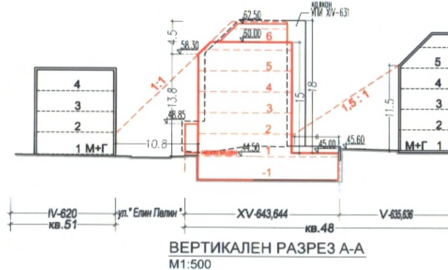
ВЕРТИКАЛЕН РАЗРЕЗ А-А M1:500