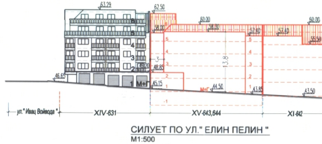
СИЛУЕТ ПО УЛ. "ЕЛИН ПЕЛИН" M1:500

на УПИ XV 643,644 , кв. 48, 16-ти м.р. север, гр. Варна ПИ 10135.3515.5079 по ККР на гр.Варна