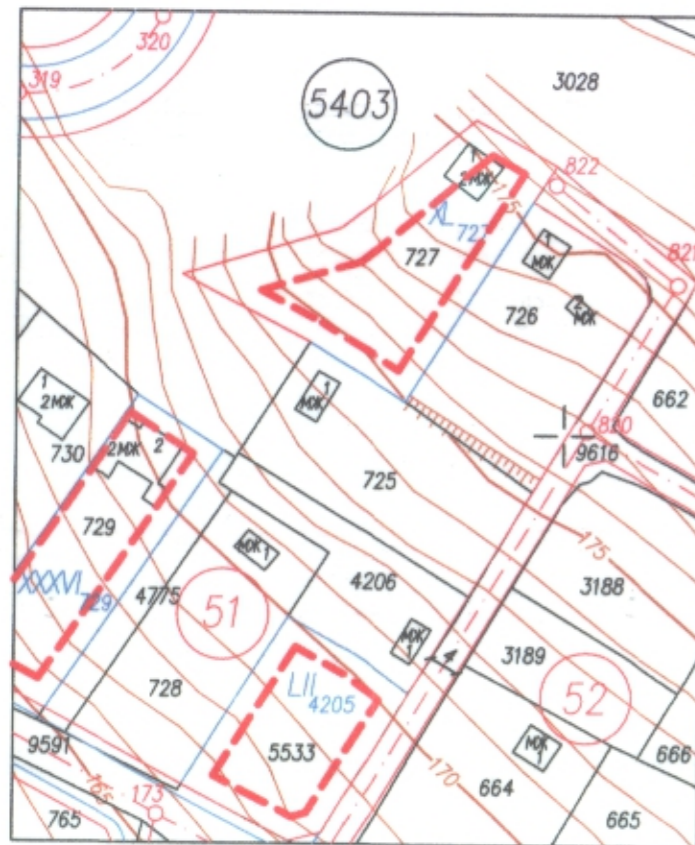
ПЛАН ЗА ЗАСТРОЯВАНЕ