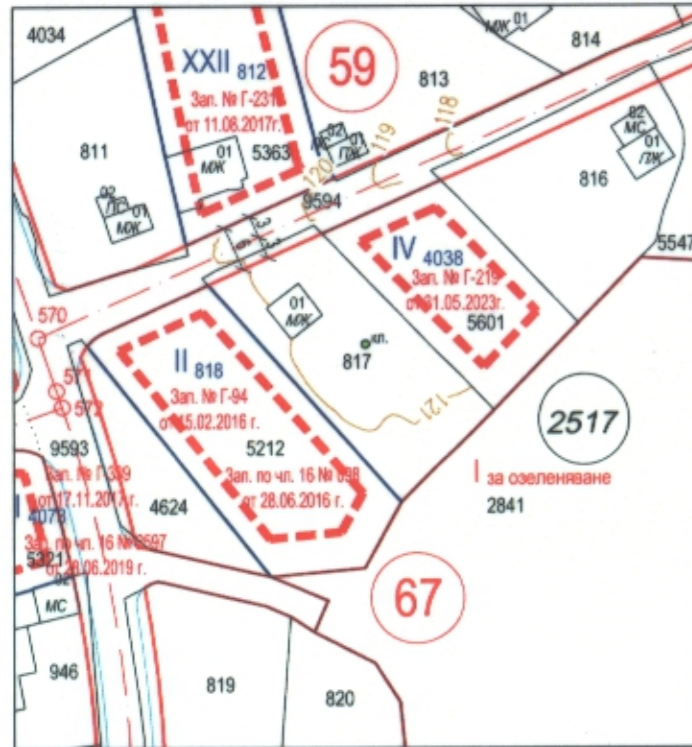
ПЛАН ЗА РЕГУЛАЦИЯ

от кадастрална карта на р-н "Приморски", одобрена със Заповед № РД-18-92/14.10.2008 г. на ИД на АГКК и ПУП-ПУР на СО "Манастирски рид, Бялата чешма и Дъбравата", одобрен с Решение № 799-5/19.12.2012 г. на Общински съвет Варна