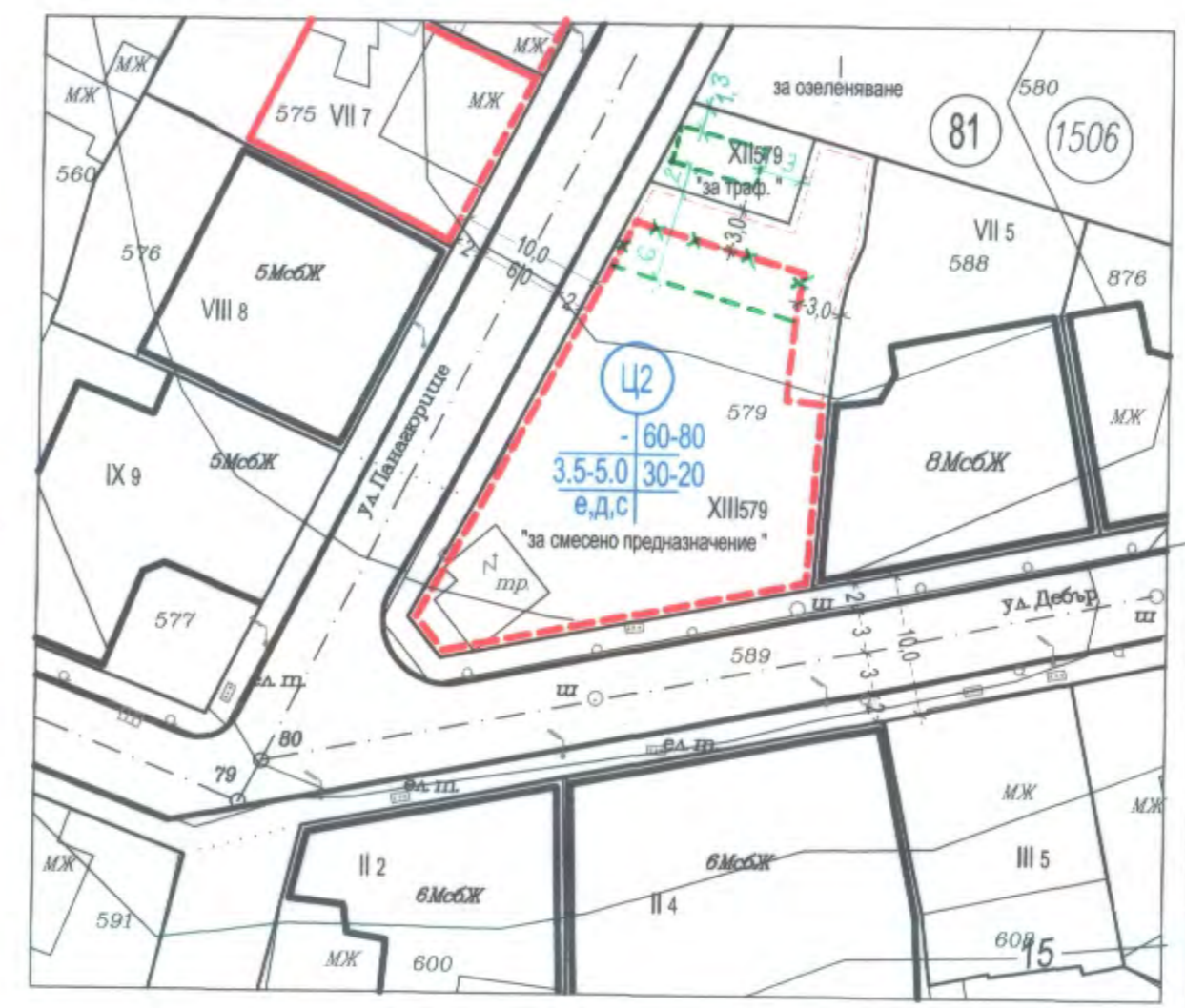
РЕЖИМИ НА ЗАСТРОЯВАНЕ