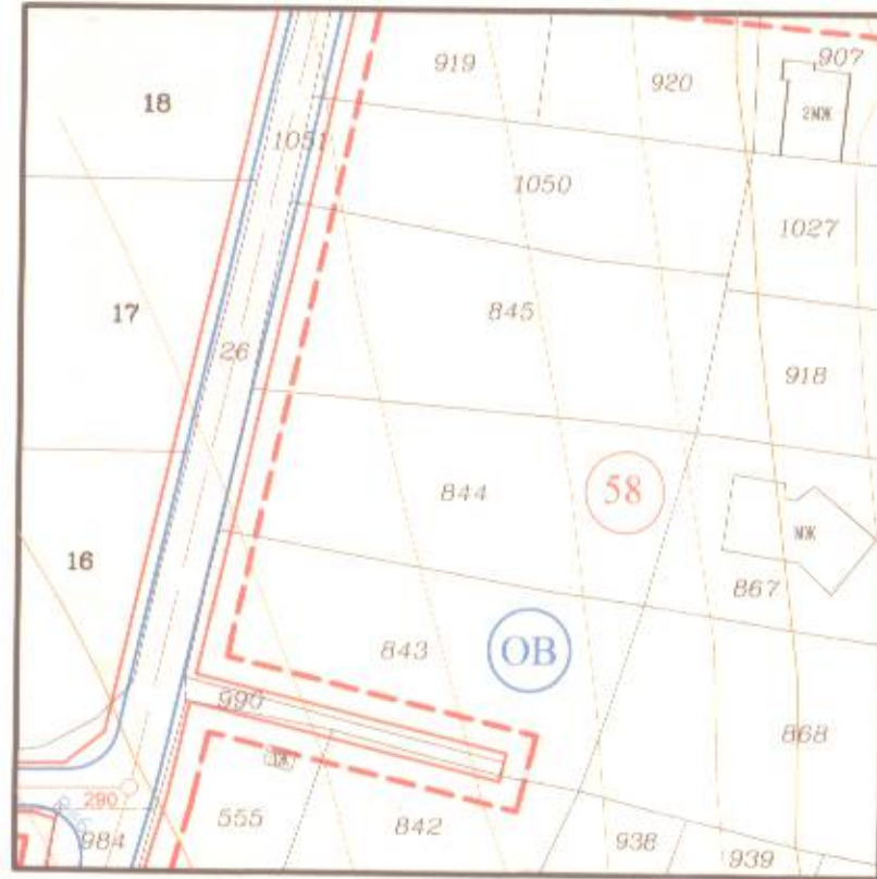
ПЛАН ЗА ЗАСТРОЯВАНЕ