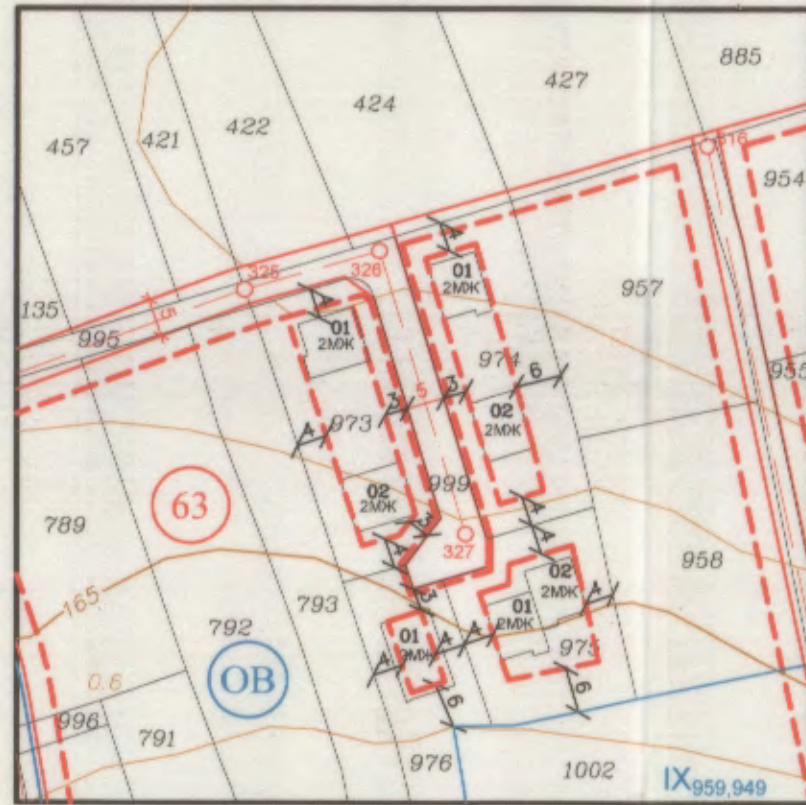
ПЛАН ЗА ЗАСТРОЯВАНЕ