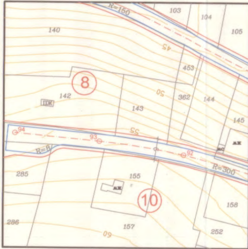
ПЛАН ЗА ЗАСТРОЯВАНЕ