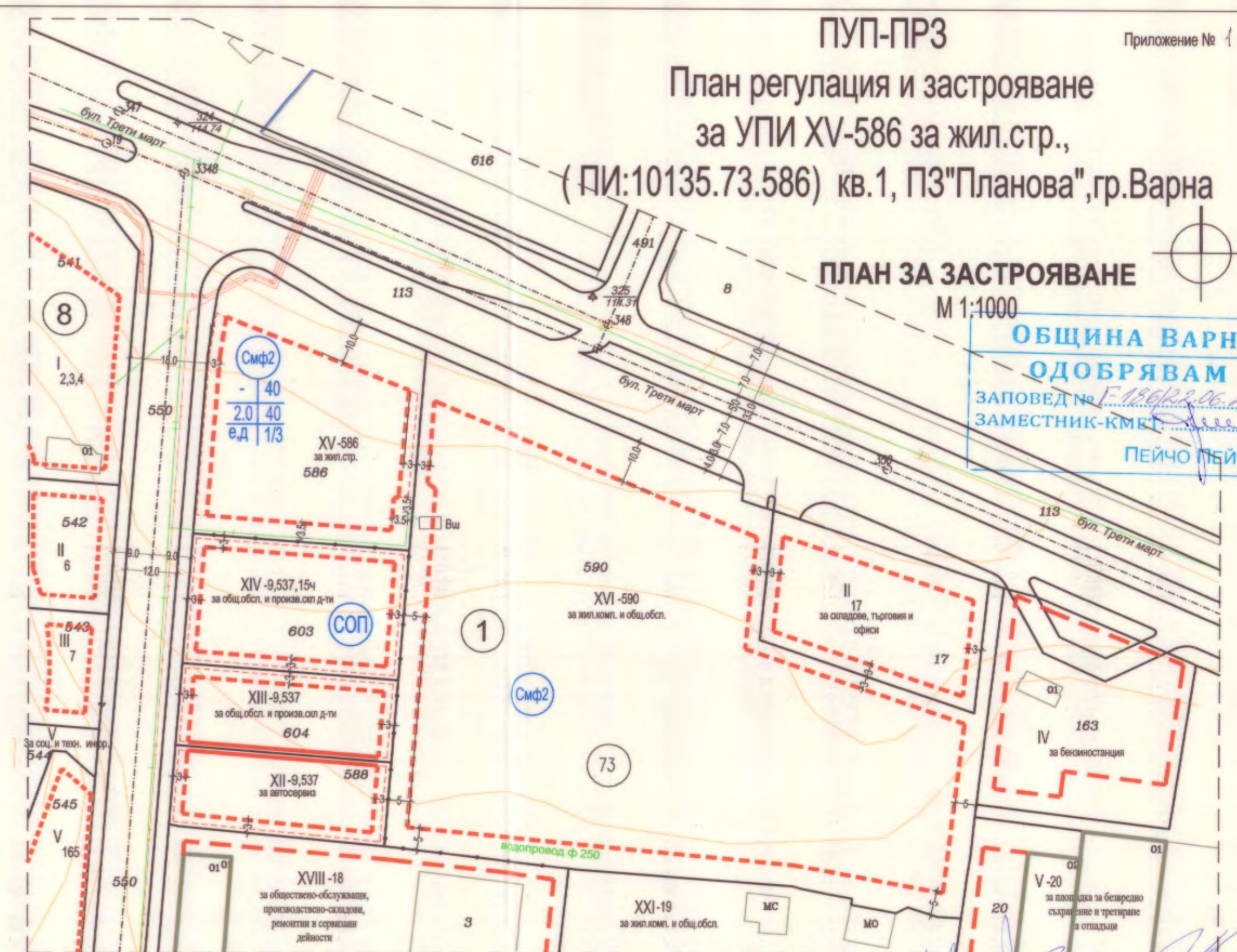
ПУП-ПРЗ План регулация и застрояване за УПИ XV-586 за жил.стр., ( ПИ:10135.73.586) кв.1, ПЗ"Планова", гр.Варна