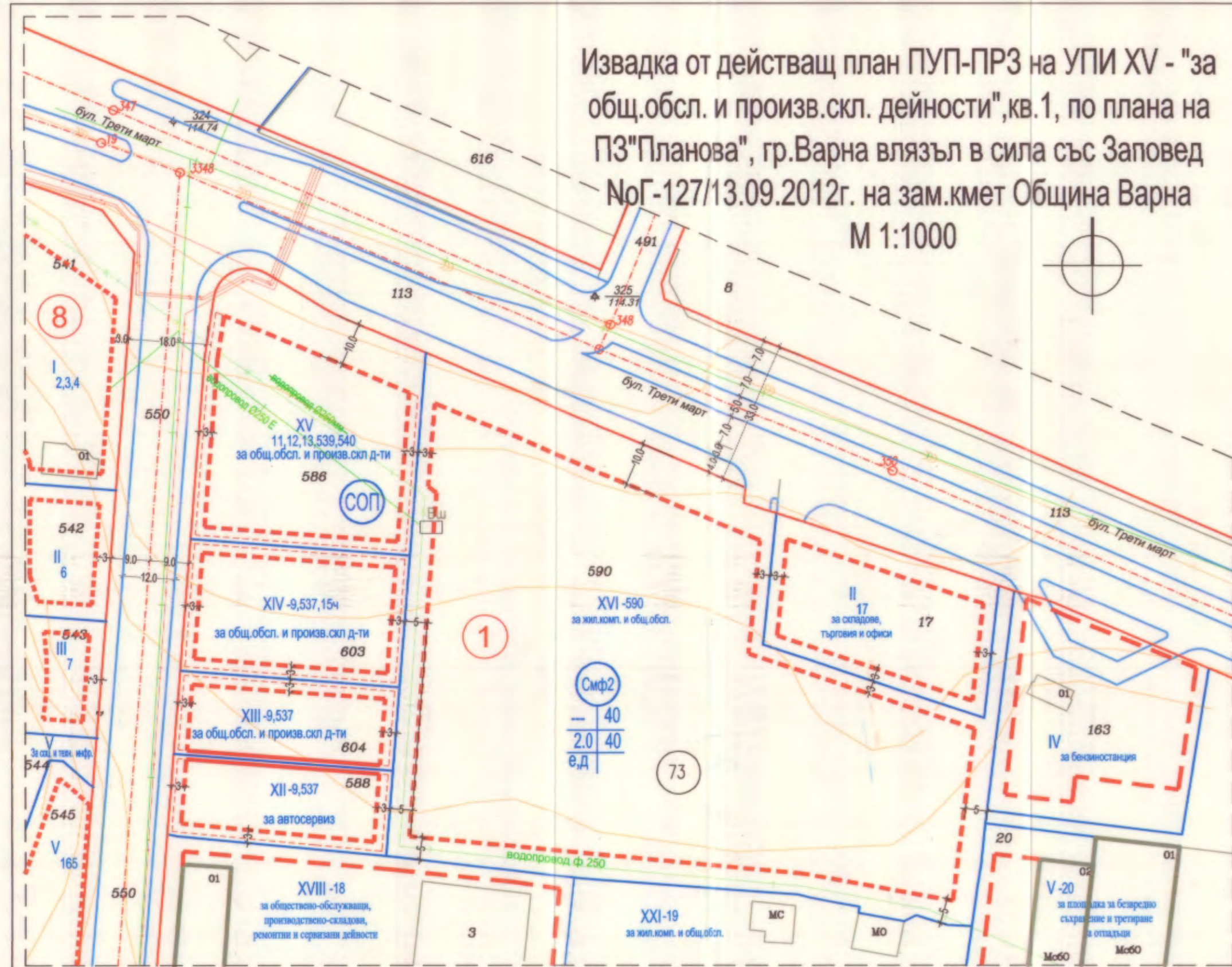
Извадка от действащ план ПУП-ПРЗ на УПИ XV - "за общ.обсл. и произв.скл. дейности", кв.1, по плана на ПЗ"Планова", гр.Варна влязъл в сила със Заповед №Г-127/13.09.2012г. на зам.кмет Община Варна М 1:1000